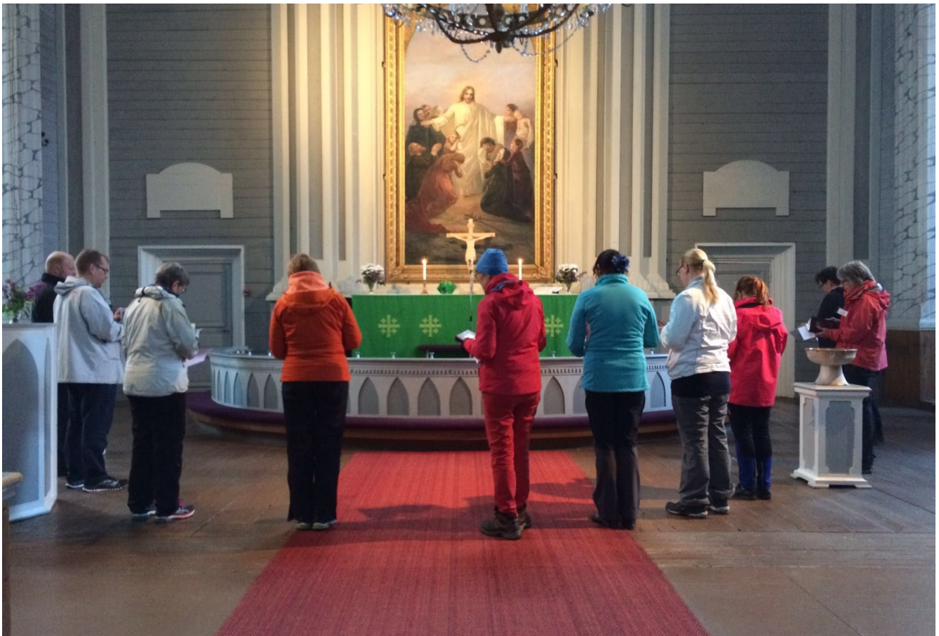
Ehtoollishetki maailman suurimmassa puukirkossa Kerimäellä