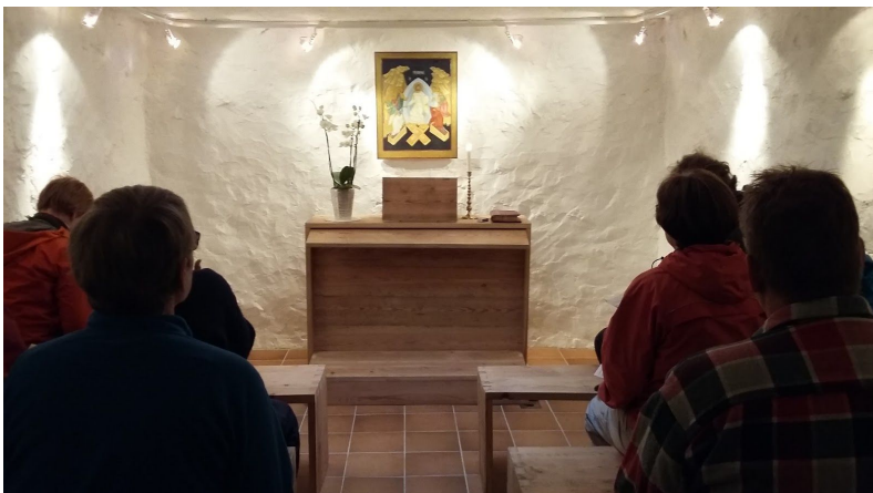
Kaukalinnan kyläkappeli on rakennettu vanhaan maakellariin.